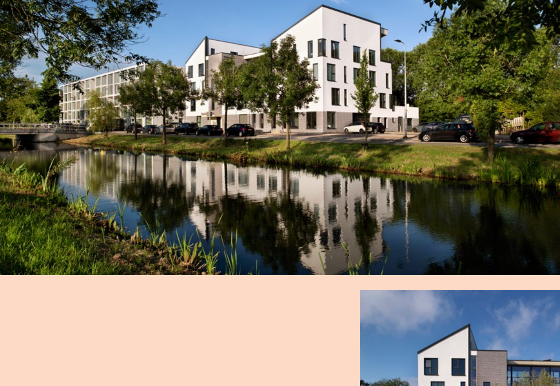
Woongebouw MarktMeesters in Utrecht

Voor de afzonderlijke woningen had Groenendaal met alle tien bewoners individuele schetssessies. 'Elk appartement is anders', vertelt hij. 'Qua woonoppervlak, indeling en prijs zijn ze afgestemd op de wensen van de bewoner. Het leuke is: ze zeggen allemaal dat zij de mooiste hebben!'