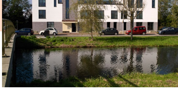
Door te delen is er in je eigen woning meer ruimte voor iets extra's als een vleugel. Daarnaast draagt uitzicht op groen direct bij aan een goed thuisgevoel.